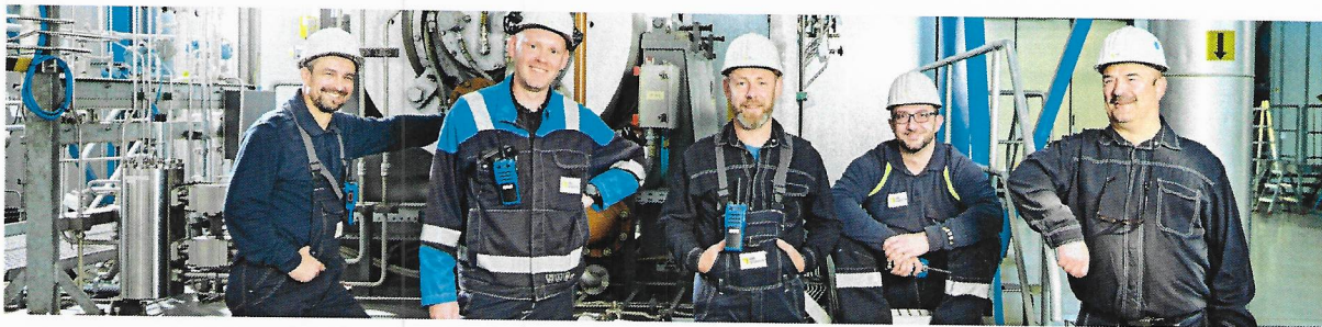
Europäischer Speicherprofi mit mitteldeutschen Wurzeln.

Wir ein hohes Maß an Erfahrung mit dem Einbau und Betrieb von Untergrundspeichern hat, setzt sich aus, Entsprechend seiner, zuverlässig und effizient laufen bei uns ständige technischen Prozesse der Gasversorgung ab. Dadurch stellen wir eine hochqualifizierte Mannschaft an allen Speicherstandorten, bestehende Know-how- und ein integriertes Qualitäts- und Sicherheitsmanagement.